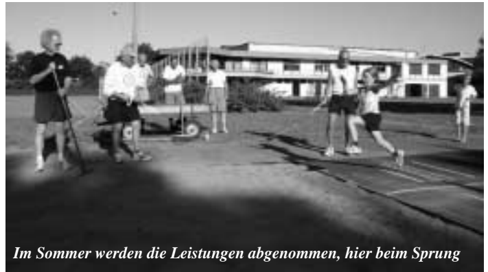
Im Sommer werden die Leistungen abgenommen, hier beim Sprung