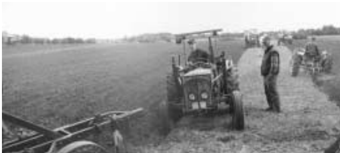
Foto oben: Demonstration des Pflügens mit alten Schleppern: vorne links ein FORDSON, vorne rechts ein FERGUSON, MF 35, beide aus den 1960-er Jahren aus England, im Hintergrund links ein McCORMICK und rechts ein INTERNATIONAL HARVESTER COMPANY, IHC 423, beide mit amerikanischem Patent Ende der 1960-er Jahre in Deutschland gebaut.