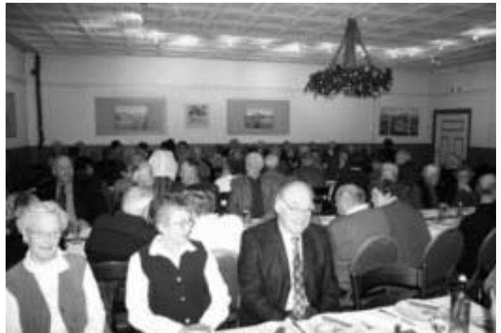
Das Publikum im vollbesetzten Saal folgt aufmerksam dem Geschehen