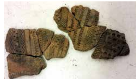
Bei den Ausgrabungen in Oeversee gefunden. Reichlich verzierte Keramikscheiben und Bernsteinperlen.

kammern, da es zur Zeit der Gräbernutzung üblich war, diese entweder gelegentlich zu säubern, bzw. auszuräumen oder aber vor dem Eingang mit Nahrungsmitteln gefüllte Gefäße als Opfergabe zu platzieren.