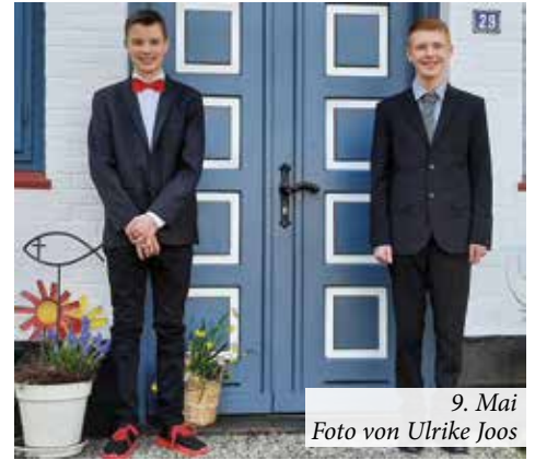
9. Mai

Das hat jedoch zur Folge, dass wir auf ein einjähriges Konfirmandenmodell umsteigen müssen: Denn dazu ist ein einheitliches Anmeldesystem innerhalb der Region erforderlich - alle übrigen Gemeinden der Sternregion haben jedoch ein einjähriges Modell. Somit wird der Jahrgang, der 2023 konfirmiert wird, erst Ende Frühjahr 2022 mit dem Konfirmandenunterricht beginnen. Alle Jugendlichen, deren Anschriften uns bekannt sind, werden von uns angeschrieben und zum Konfirmandenunterricht eingeladen. Aber auch alle anderen sind herzlich zum Konfirmandenunterricht eingeladen.