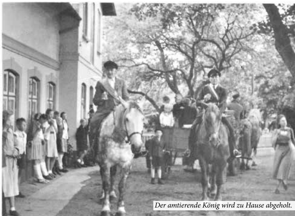
Der amtierende König wird zu Hause abgeholt.

Neben dem Ringstechen gab es noch das Trab-